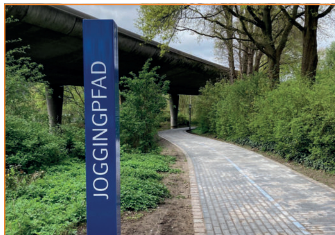
Die Stele markiert den Eingang zum Joggingpfad

Die Kosten der Gesamtmaßnahme belaufen sich auf rund 450.000 Euro. Rund 275.000 Euro davon wurden vom InvestitionsPakt Sport bereitgestellt. Mehr Infos hier .