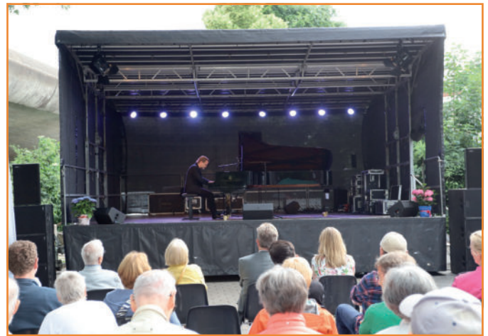
Sommerfestival mit Staraufgebot

Das Harburg-Huus, die DRK-Obdachlosenunterkunft für wohnungslose Menschen mit Hund, führte am Freitag, 30. Juni, von 14 bis 23 Uhr, ein erstes großes Straßen-Sommerfestival rund um das Harburg-Huus am Außenmühlenweg 10b durch. Anlass war der fünfte Geburtstag der Einrichtung, die sich als offenes Haus versteht und deshalb die Nachbarschaft aus dem Stadtteil, Freunde und Förderer, Netzwerkpartner und Interessierte eingeladen hatte. Der Eintritt zu allen Auftritten an dem Tag war frei. Am Veranstaltungsabend kamen sehr viele positive Rückmeldungen zur Arbeit des Harburg-Huuses und zum Fest sowie etliche Anfragen zu Möglichkeiten ehrenamtlichen Engagements. Der Erfolg des Straßenfests bestärkt, dies erneut durchzuführen.