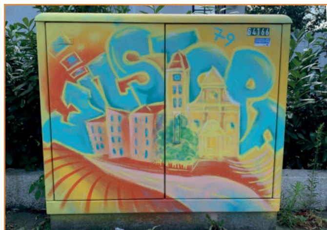
Wilstorf wird bunt (Jägerstraße / Mensingstraße)

Sie möchten auch gerne Kunst draußen und für alle sichtbar machen (lassen)? Dann melden Sie sich bei uns. Teilen Sie uns hier Ihre Idee mit, wir unterstützen sehr gerne.