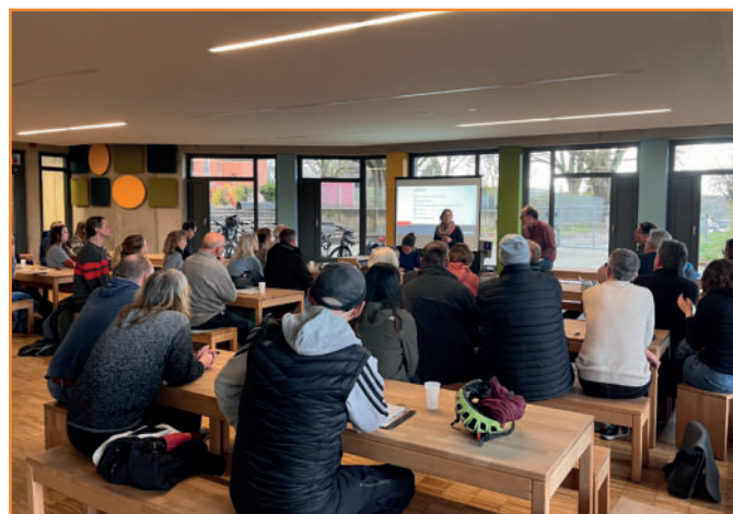
Mobilität in Wilstorf - Fokus Radfahren

Das Gebietsmanagement hat in der Veranstaltung die Fragen gesammelt und vor Ort beantwortet oder zur Klärung an entsprechende Stellen weitergeleitet. Die Fragen aus dem Plenum waren vorwiegend an Themen rund um die Winsener Straße , Radwegeausbau und die Qualität der Radwege gerichtet. Besuchen Sie unsere Webseite zur Einsicht des Protokolls.