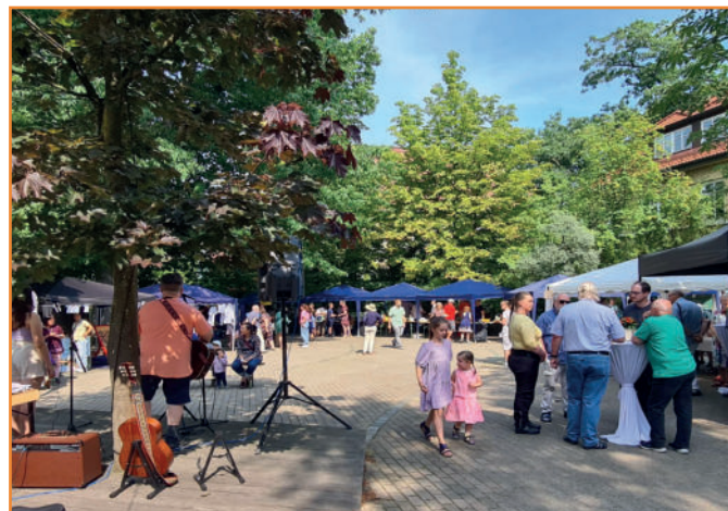
Das Sommerfest am 09. Juli hatte großen Zulauf

„Am 09.07.2023 hat die Pfarrei St. Maximilian Kolbe am Standort Reeseberg ein Sommerfest organisiert. Es waren 18 Helfer dabei! Getränkestand, Grillstand, Kaffee und Kuchen, Hüpfburg, Kinderspiele und eine Jugendband haben mit Musik für Unterhaltung gesorgt. Die Pfadfinder haben einen Waffelstand gemacht. Am Sonntag haben wir dann mit einem Kindergottesdienst um 10:00 Uhr begonnen. Danach mit 25 Helfern den ca. 250 bis 280 Besuchern aus dem Stadtteil und der Gemeinde einen schönen Tag der Begegnung bereitet. Die Kinder haben am Schminkstand und an den Spielständen viel Spaß gehabt. Viele helfende Hände waren dabei. Wir wollen es am 07.07.2024 wiederholen.“ (Quelle: Bericht Sommerfest)