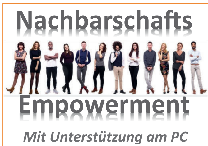
Digital Empowerment - Finanziert durch den Verfügungsfonds

Anmelden unter: Alltagsbegleiter@drk-harburg.hamburg