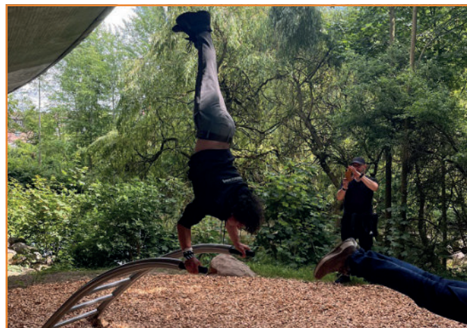
Übung macht den Meister - Eine Showeinlage am 2.6.2023 am Joggingpfad

Ihr Ziel: Die Leute vor Ort zusammenbringen und auf die Calisthenics-Anlage aufmerksam machen. Gemeinsam die Motivation für Bewegung in allen Teilnehmenden wecken. Zielgruppe: Kinder, Jugendliche, Erwachsene, Senioren. Mehr Infos.