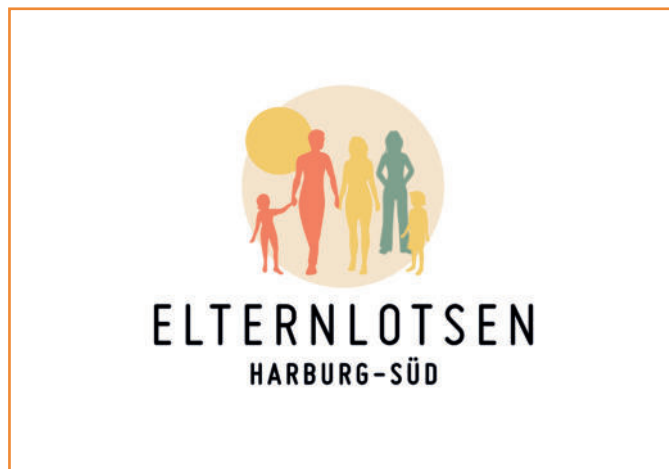
Die Elternlotsen sind freuen sich über Zuwachs