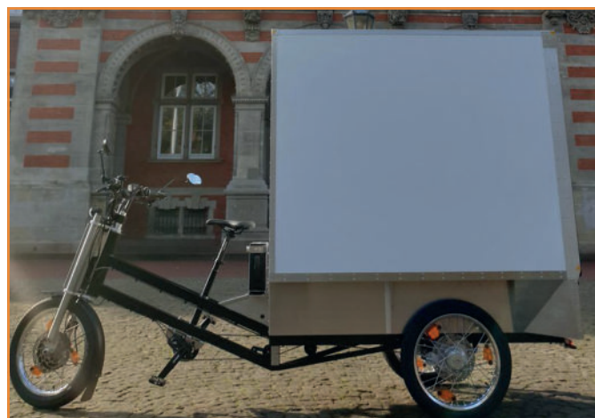
Das Cargobike können alle leihen

Bislang wurden vier Switch-Stationen umgesetzt (u.a. Max-Halbe-Straße) und es werden acht weitere folgen, so auch in der Radickestraße. Ebenfalls ist eine Cambio-Station in Kooperation mit dem Eisenbahnbauverein am Reeseberg in Vorbereitung. Noch ein Geheimtipp: In der Knoopstraße im Fahrradgeschäft Bakkie in der Knoopstraße kann ein Cargobike (1 €/Stunde) geliehen werden. Weitere Infos über KoGoMo findet ihr hier und auf der KoGoMo- Webseite .